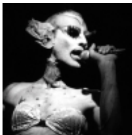
Sirenas del corazón

Del 20 de abril al 16 de mayo de 2004. Sala J, C.C. Recoleta, Junín 1930, Buenos Aires.