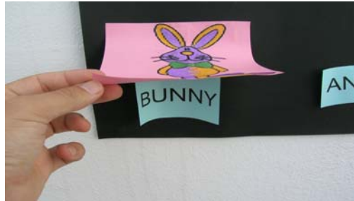
(fig.1 )Muestra la manera de combinar imagen y palabras

para los alumnos. Además tenemos esa gran fuente de motivación que es la canción. La motivación aumenta al aprovechar todas las representaciones simbólicas, fotos, dibujos, palabras y la propia melodía. Ejemplo (fig.1)