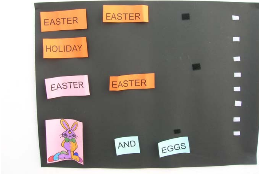
Figura 3. Canción de Easter.

Los resultados son muy positivos. Hemos llegado a la conclusión de que a través de este método, el idioma entra a través de los sentidos por medio de miles de estímulos y en el aprendizaje de las lenguas debemos aprovecharlo ya que facilitan el proceso de adquisición de sonidos, entonación, acento, etc.