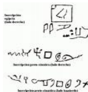
(fig.1 ) Jeroglífico egipcio

" Pictograma " es el nombre con el que se denomina a los signos de los sistemas alfabéticos o aleatorios basados en dibujos significativos. Por ejemplo, en la civilización Maya, los dibujos que están representados en las pirámides son pictográficos: la mazorca de maíz no sólo se representa a si misma sino que también representa la fertilidad. Ejemplo (fig.1)