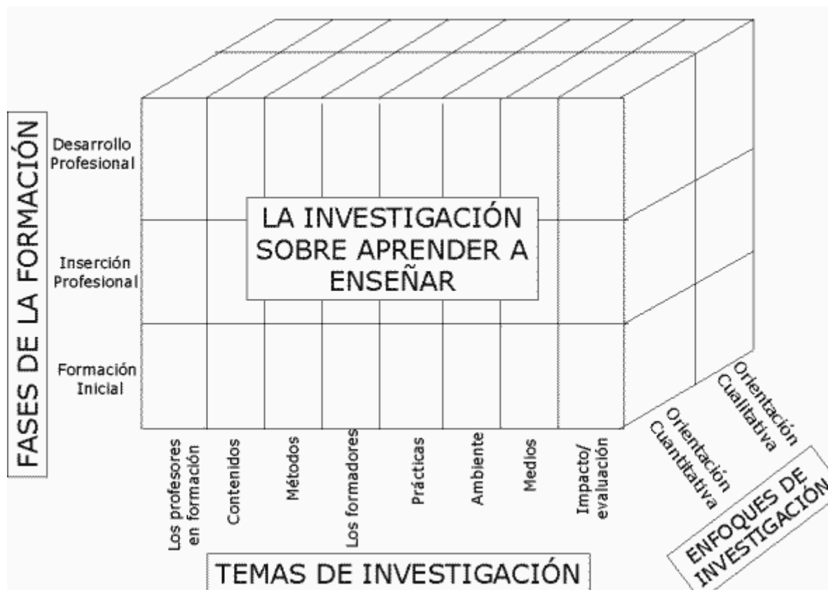
Figura 1. Tres dimensiones para explicar el proceso de aprender a enseñar

Una segunda dimensión que consideramos importante incorporar en cualquier revisión sobre la investigación en el proceso de aprender a enseñar tiene que ver con los temas . Hemos hecho un esfuerzo de síntesis diferenciadora para reducir a ocho los temas posibles. Nos basamos en el trabajo que hace ya algunos años realizaron Katz y Rath (1985). Los temas en cuestión se refieren a los profesores, sus conocimientos, creencias, disposiciones, actitudes, autoeficacia percibida, etc., los contenidos de la formación, los métodos y estrategias formativas, los formadores de profesores, las prácticas, así como el ambiente y la evaluación. Estos temas, evidentemente se mezclan en muchas investigaciones pero pueden servir como marco de referencia para clasificar la investigación.