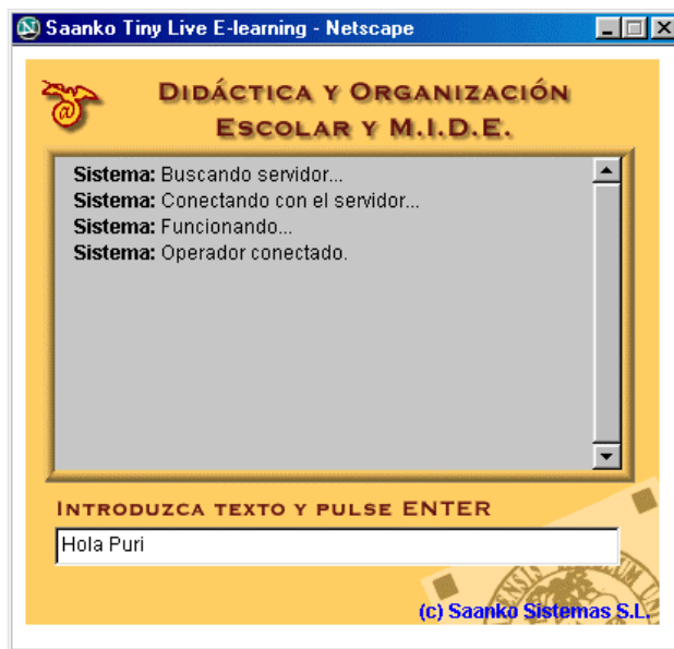
Figura 1. Ejemplo de personalización del Live E-Learning.

inmediato, atendiendo a través de la red cualquier tipo de consulta que hagan los alumnos. Es eficaz, inmediato, directo, totalmente personalizable al docente, ya que éste puede presentar en el icono de inicio del recurso la imagen que desee (foto, logo de la Universidad, etc...).