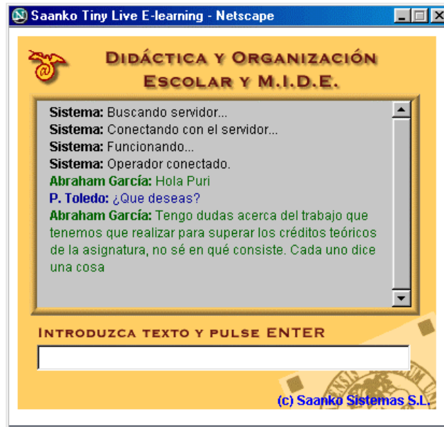
Figura 3. Ventana que se abre al alumno.

Otra característica importante es que Saanko Live E-Learning permite hacer un registro de todas las conversaciones mantenidas con los alumnos, éstas son guardadas en archivos y consultables por fecha. Así el profesor podrá en cualquier momento estudiar de inmediato las consultas realizadas por sus alumnos.