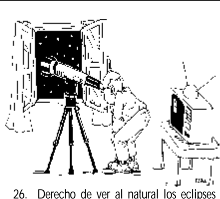
26. Derecho de ver al natural los eclipses de Luna, cometas y otros fenómenos siderales, y no solamente en el Telediario.