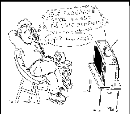
27. Derecho a no contestar encuestas telefónicas sobre programas de la tele.