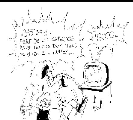
28. Derecho al pataleo.