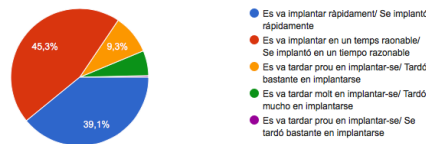
Figura 2. Valoració del temps de resposta

5. COM VALORA VOSTÈ EL TEMPS QUE EL CENTRE ESCOLAR DEL SEU FILL/A VA TARDAR EN IMPLANTAR LA RESPOSTA EDUCATIVA A DISTÀNCIA? ¿CÓMO VALORA USTED EL TIEMPO QUE EL CENTRO ESCOLAR DE SU HIJO/A TARDÓ EN IMPLANTAR LA RESPUESTA EDUCATIVA A DISTANCIA? 1.021 respuestas