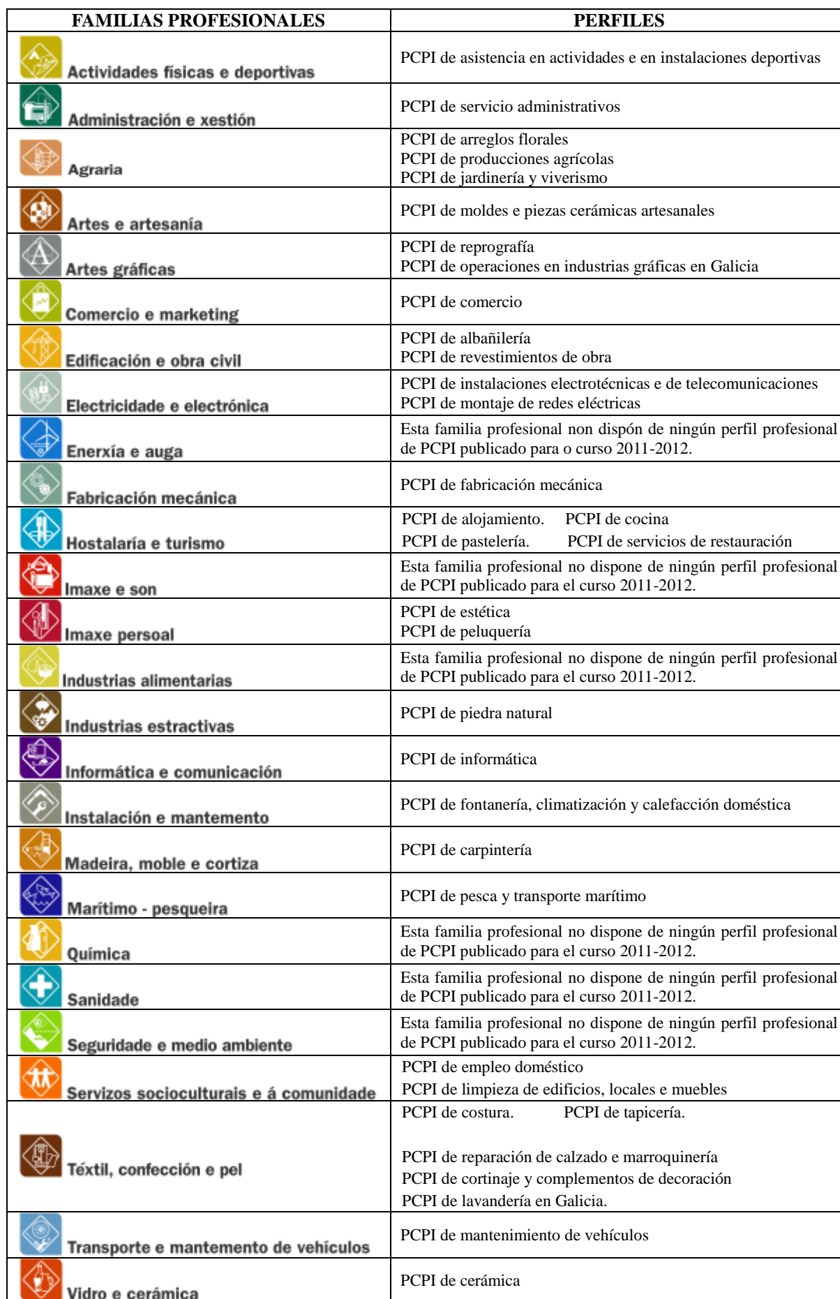
Tabla 3. Familias profesionales y perfiles de los PCPI ofertados en Galicia