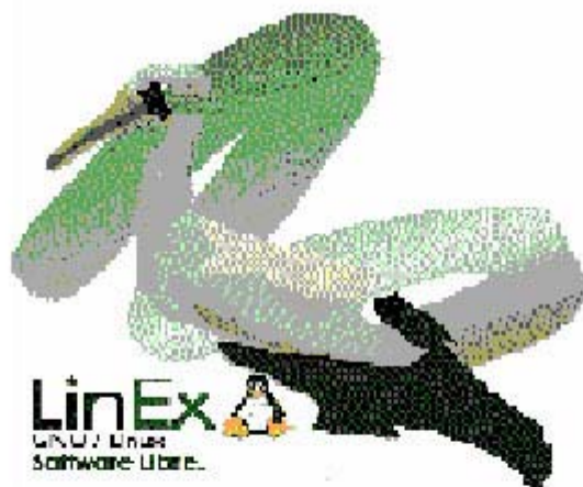
Gráfico 3. GNU/LinEx, el sistema operativo de la Junta de Extremadura.

Para poner en marcha todo este proyecto, la Administración Autónoma extremeña optó por la utilización de software libre en lugar de destinar amplias partidas presupuestarias a la adquisición de licencias de uso por contratos de servicios. Se pensó en un sistema que, apoyado en la participación de todos los usuarios, permitiera realizar y distribuir gratis las copias necesarias y garantizara actualizaciones de acuerdo con las necesidades detectadas a partir de su aplicación en los diferentes centros educativos. Se trata por tanto de un sistema que está siendo mejorado constantemente por una amplia comunidad de usuarios (ver gráfico GNU/LinEx, el sistema operativo de la Junta de Extremadura).